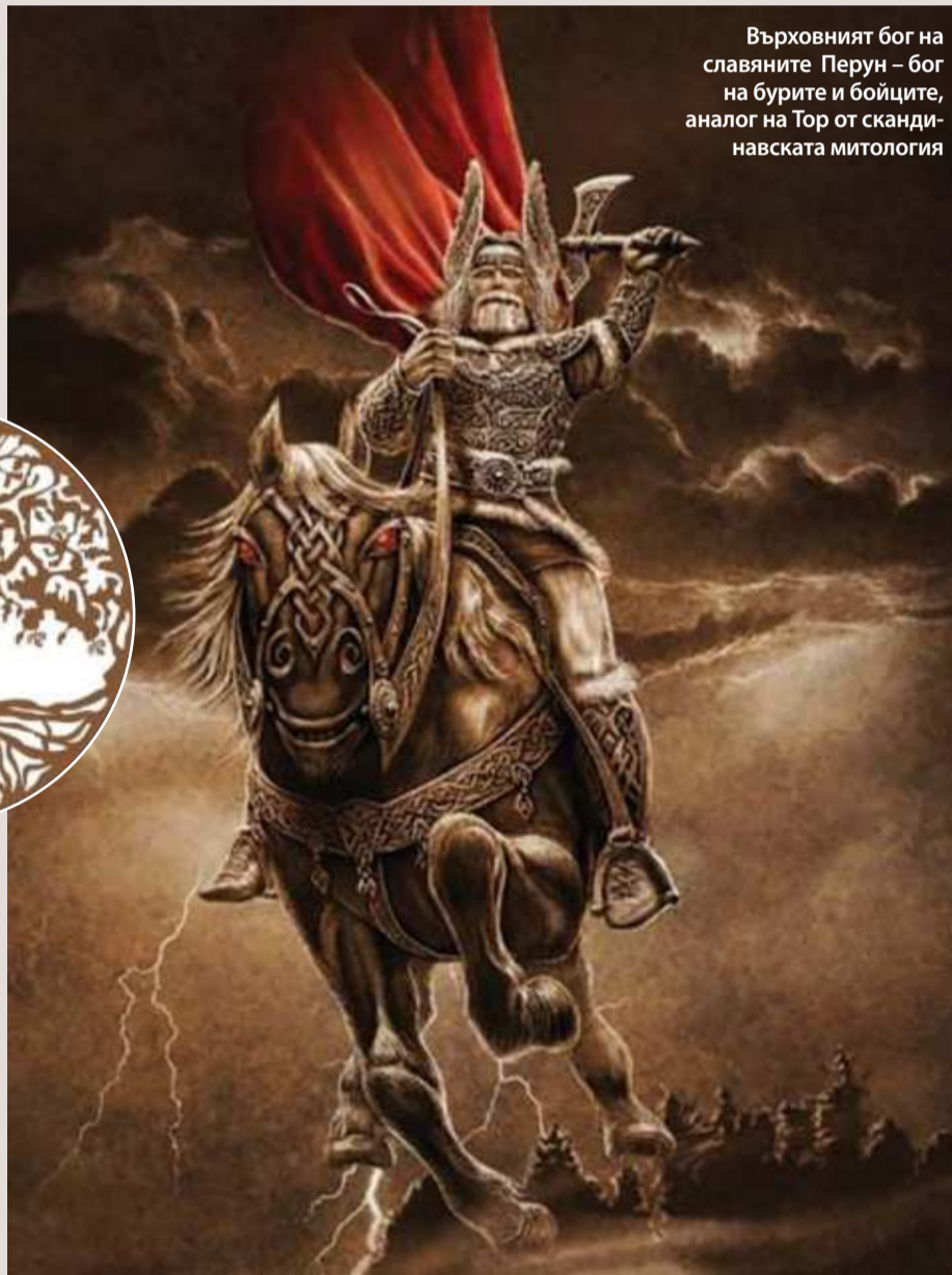
Върховният бог на славяните Перун – бог на бурите и бойците, аналог на Тор от скандинавската митология