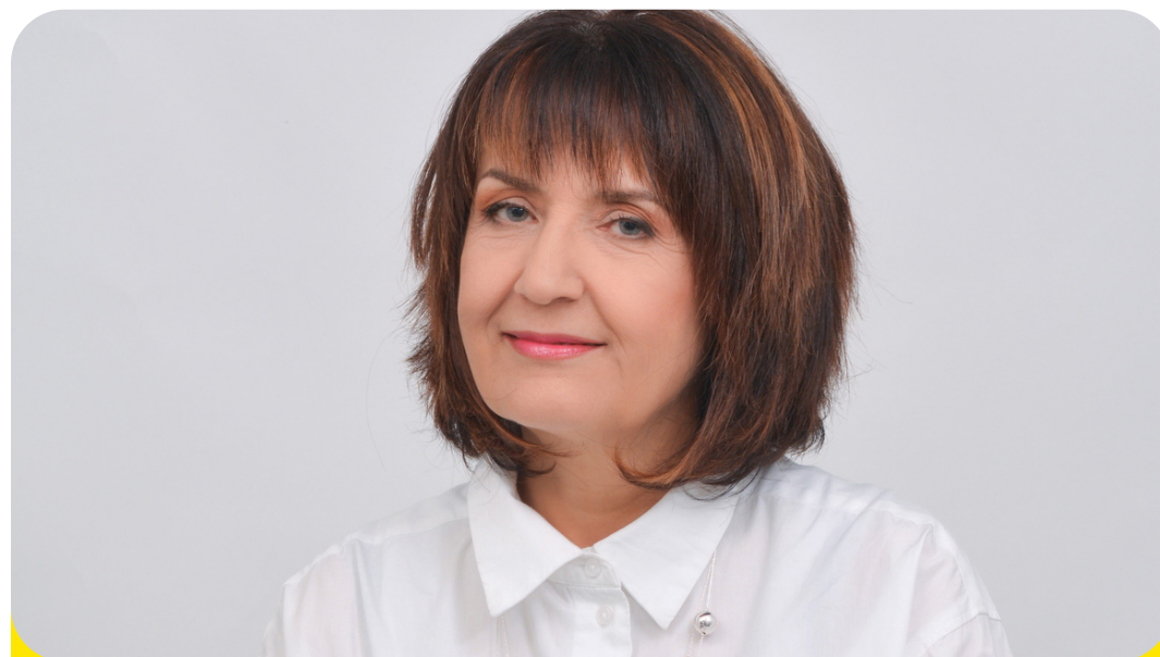
проф. Веселина Вълканова Софийски университет

Декан на ФЖМК и признат изследовател в полето на визуалната комуникация и медийния дизайн. Автор на над 100 научни публикации. Член на редица международни редколегии.