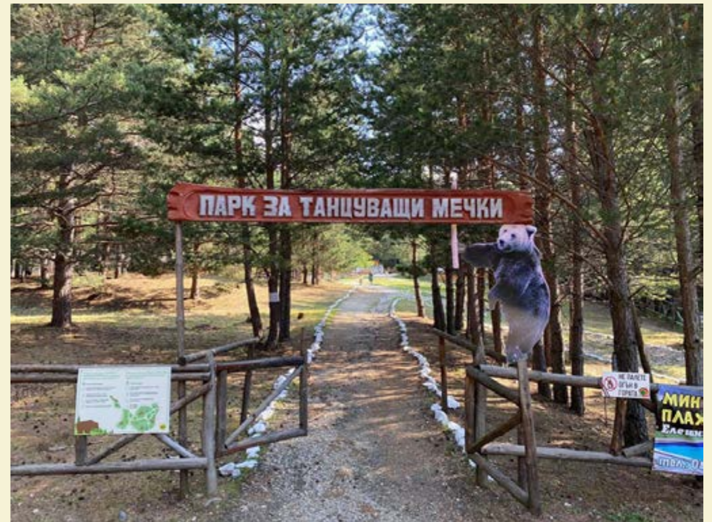
Паркът има алеи, от които мечките могат да се наблюдават в естествената им среда

В началото мечките показват признаци на нервност и стрес, защото са свикнали на несигурен живот, в който недохранването и насилието са ежедневие. Някои от тях дори визуално носят белезите на това робство като например Стефан, който при пристигането си има възпалена лигавица от халките на носа, и Виолета, която има болест на кожата в резултат на недохранване и тормоз. С времето обаче всички обитатели започват