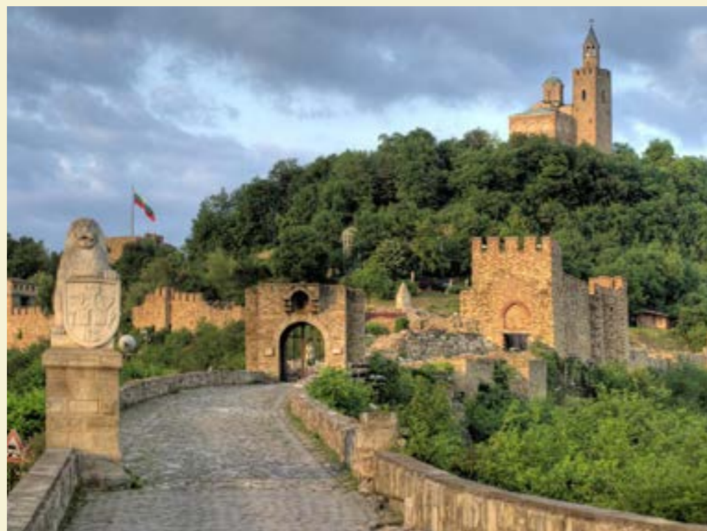
Хълмът Царевец

в историческия комплекс. Следи от живот, датиращи от късния халколит (4200 г. пр.н.е.) могат да бъдат намерени на хълма Царевец, който е бил обитаван и през бронзовата и желязната епоха. Археологическите разкопки разкриват останки от жилища и керамика от халщатската култура (XIII – V в. пр.н.е.) и по-късната латенска култура (V – I в. пр.н.е.). Тракийското селище, съществувало под руините на средновековната българска столица, процъфтява през цялото първото хилядолетие пр.н.е. Въпреки това оживената дейност на хълма през вековете, особено през Средновековието, до голяма степен е заличила тези следи. Само малки участъци остават под последващите структури, произхождащи от два различни жилищни периода през IV – II в. пр.н.е. Тези жилища и огнища показват характерни характеристики на тракийската култура, заедно с различни керамични ар-