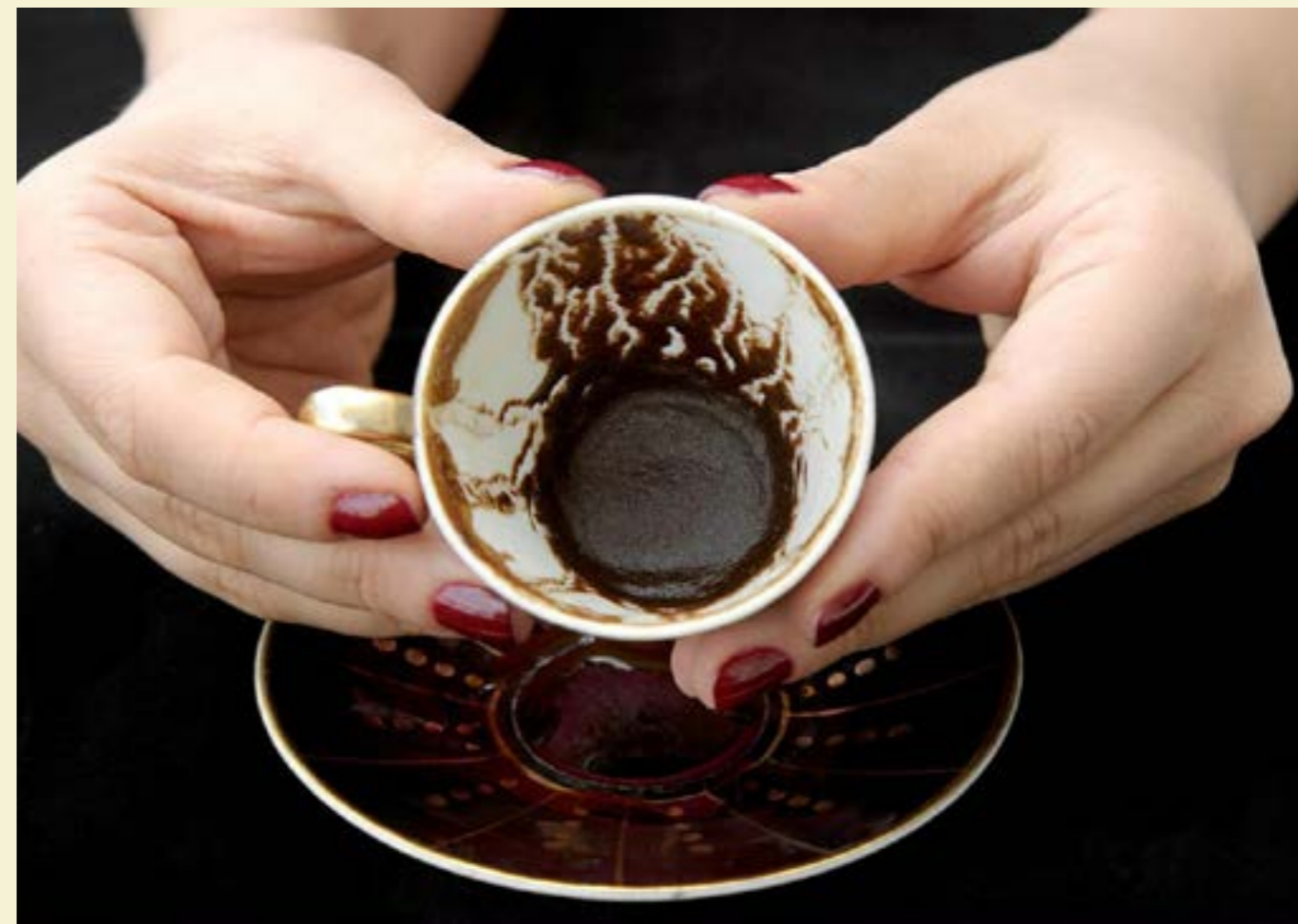
Гледането на утайка от кафе също е разпространено сред славянските народи

нещастия. Тези предмети се предават през поколенията, като всеки носи енергията на предците. Има различни магически места в дома, които са свещени – например прага и огнището. Около тях не трябва да се правят магии. Старите българи са поставяли клон-