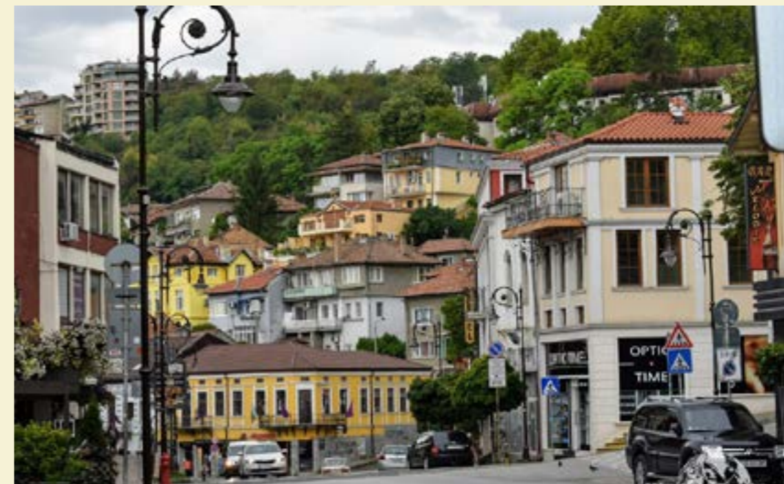
Из улиците на старата столица