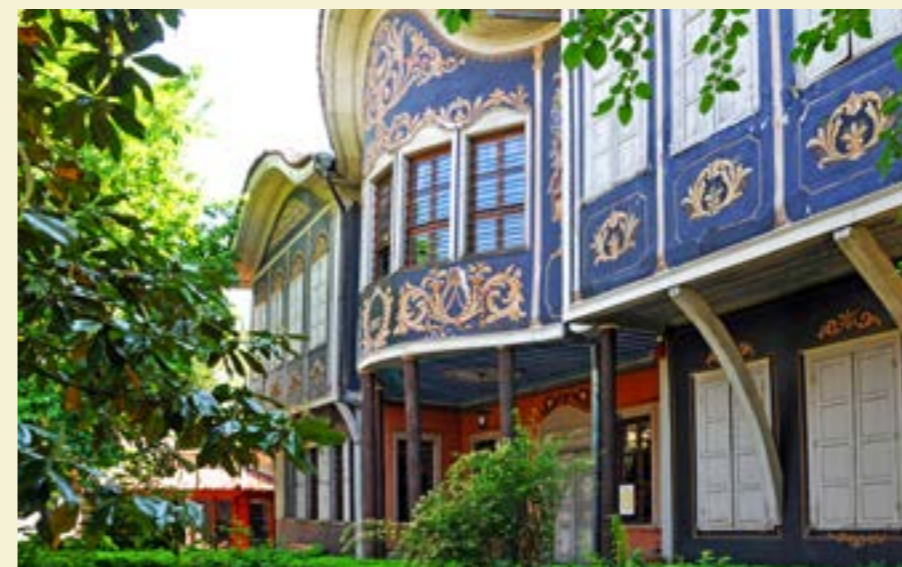
Красивите стари къщи в Пловдив