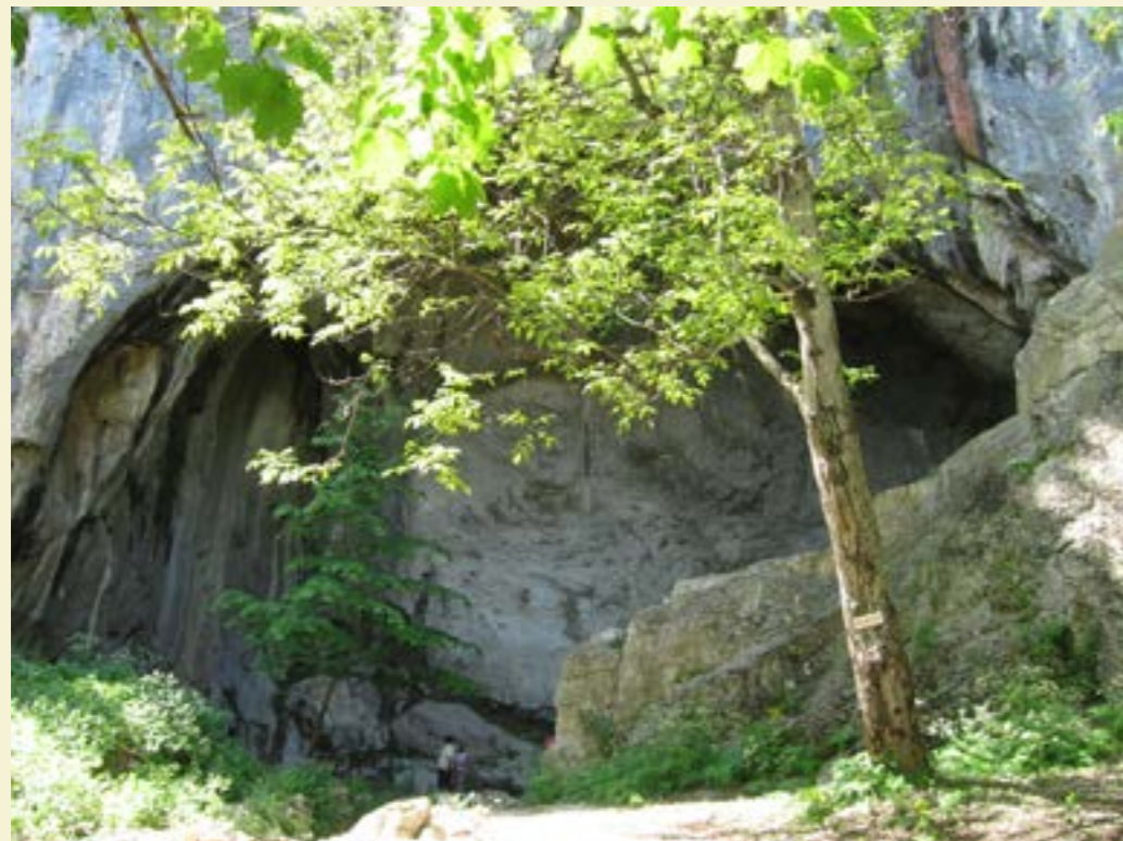
До манастира се намира пещера с карстов извор

Първите писмени сведения за манастира са от времето около 1544 г., но е възможно обителта да е много по-стара. Със сигурност през 1822 г. в него е била създадена първата работилница за щамповане на икони по българските земи. В манастира е имало ателие на Чипровската златарска школа за църковна утвар и накити. През Възраждането манастирът е духовно средище с килийно училище и книжовна школа, в която творят Йосиф Брадати и неговият ученик Тодор Врачански.