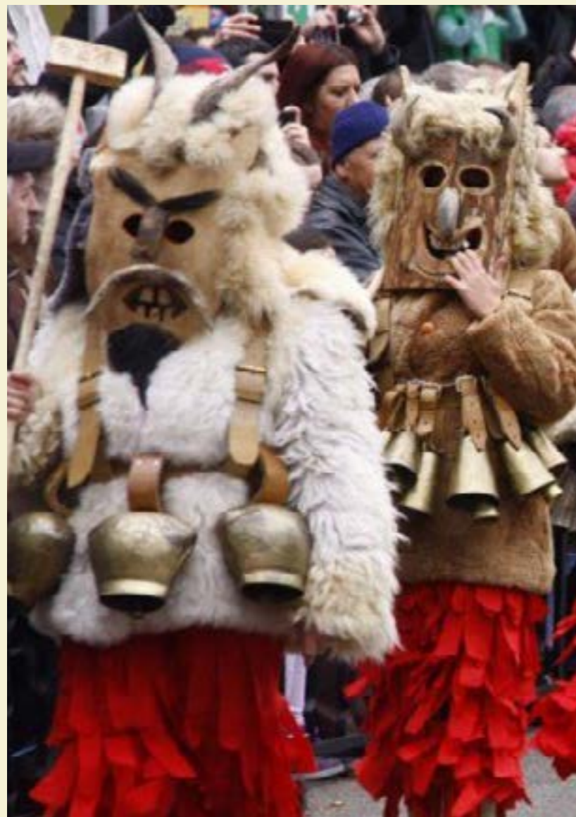
Кукерите на фестивала Сурва

летта на 1-ви март. На тази дата хората си разменят червени и бели тъкани конци (мартеници) като символ на здраве, берекет и смяна на сезоните. Те носят тези конци, докато видят щъркел или цъфнало дърво, след което ги връзват на клони, за да се сбъдне пожеланието за късмет и да се предпази човек от болести. Шевицата е