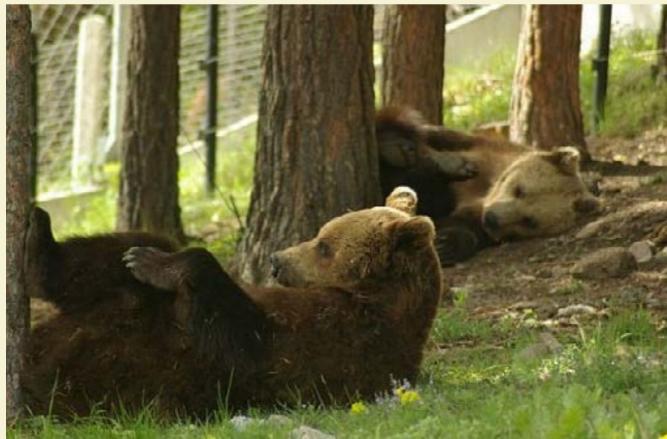
Днес мечоците живеят щастливо в Белица