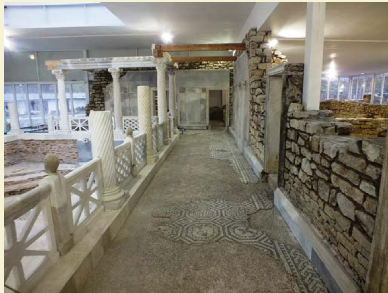
Част от запазената музайка на вилата

Античната градина също е цялостно възстановена, в нея е устроен „театрон“ за атракции на открито. Усърдният труд на историци, археолози и специалисти доставя удоволствието на посетителите днес