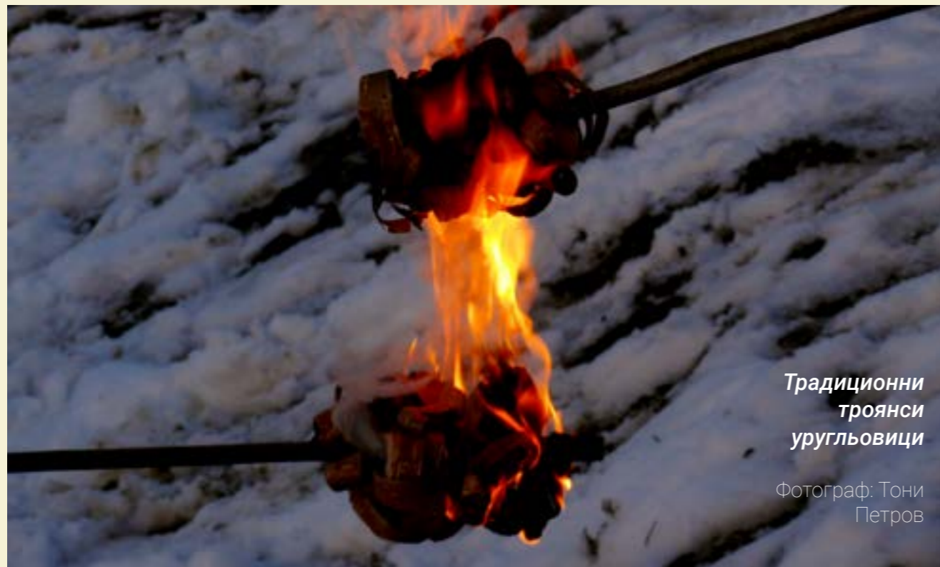
Традиционни троянски уругльовици