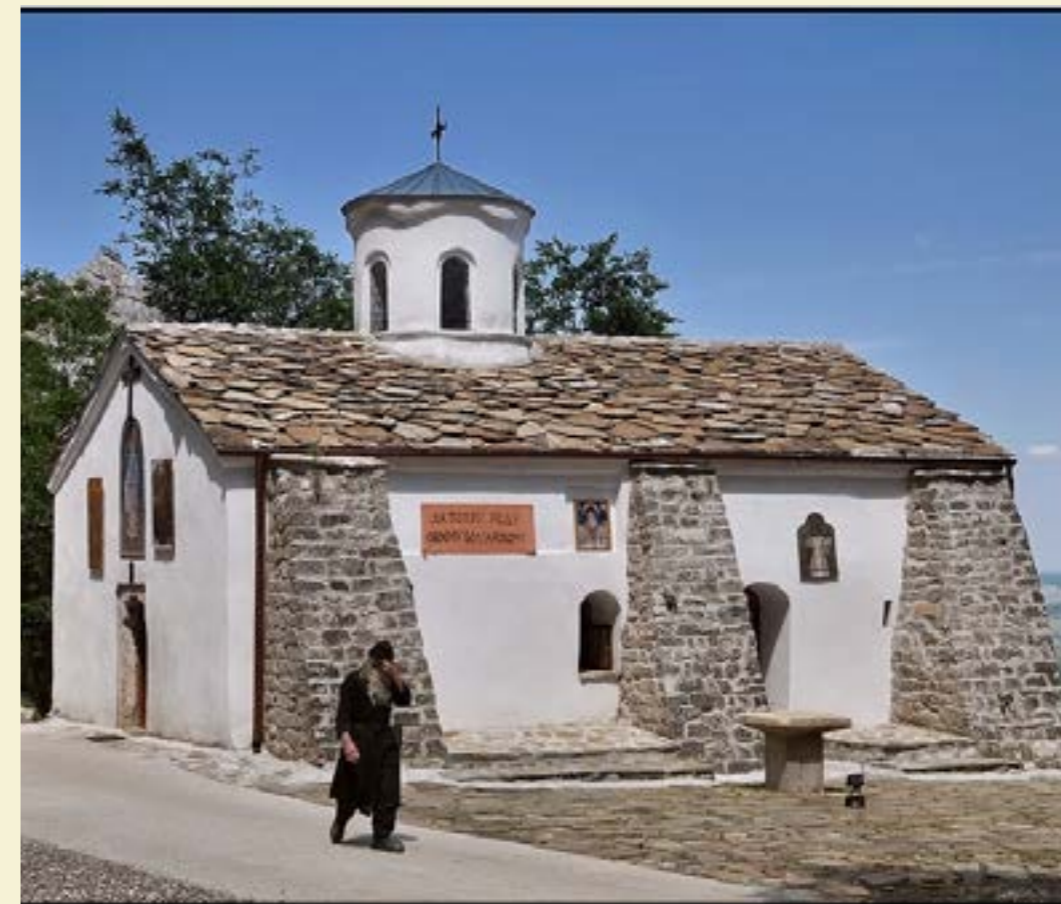
Църквата на манастира „Св. Иван Пусту“