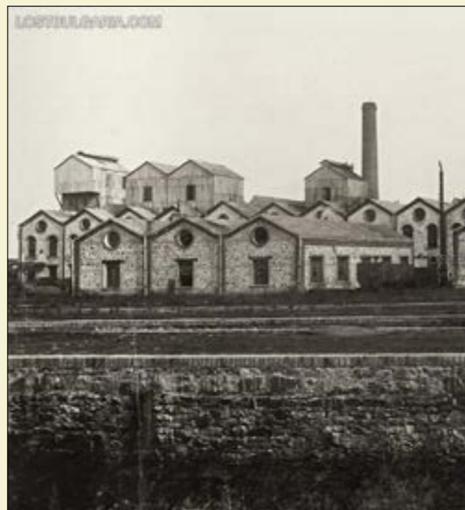
Захарната фабрика, когато е работела