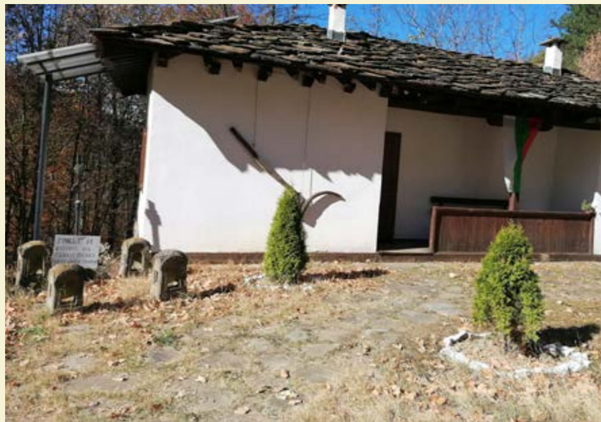
Гробът на хайдут Велко на ъгъла, където се пресичат двете стрехи

Светилището намира своето убежище на западния склон на връх Иван дял, издигащ се на височина 1046 м в Троянския балкан, до който може да се стигне, ако се продължи още час нагоре от указателната табела пред скита. От манастирската летопис се разбира, че „Св. Никола“ е съществувал още от 1794 г., когато е служел за скривалище на монасите при нападения от разбойници. Разширен е от игуменът на Троянския манастир, йеромонах Паисий от