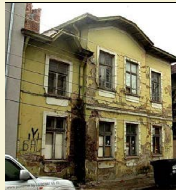
Къщата на поета – разрушена

За да не бъдем твърде големи песимисти, хубаво е да се спомене и една сграда с културно значение, която в последните години беше възстановена, след като с години стоя порутена. Това е къщата на поета Христо Смирненски, която се намира на ул. „Овче поле“ №116 близо до метростанция „Опълченска“. Там от 1916 до 1923 г. живее цялото семейство Измирлиеви, както е и истинската фамилия на поета. По това време къщата се е намирала в покрайнините на града и е мястото, където най-вероятно