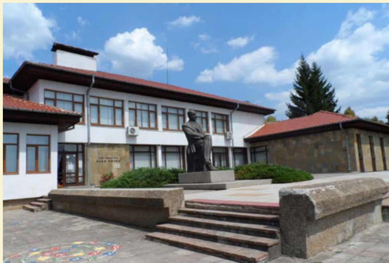
Паметникът на Елин Пелин в центъра на селото