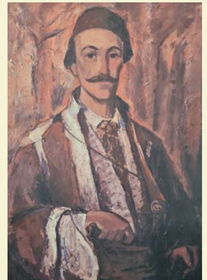
Хайдут Велко от Шумен Художник: Иван Пеевски