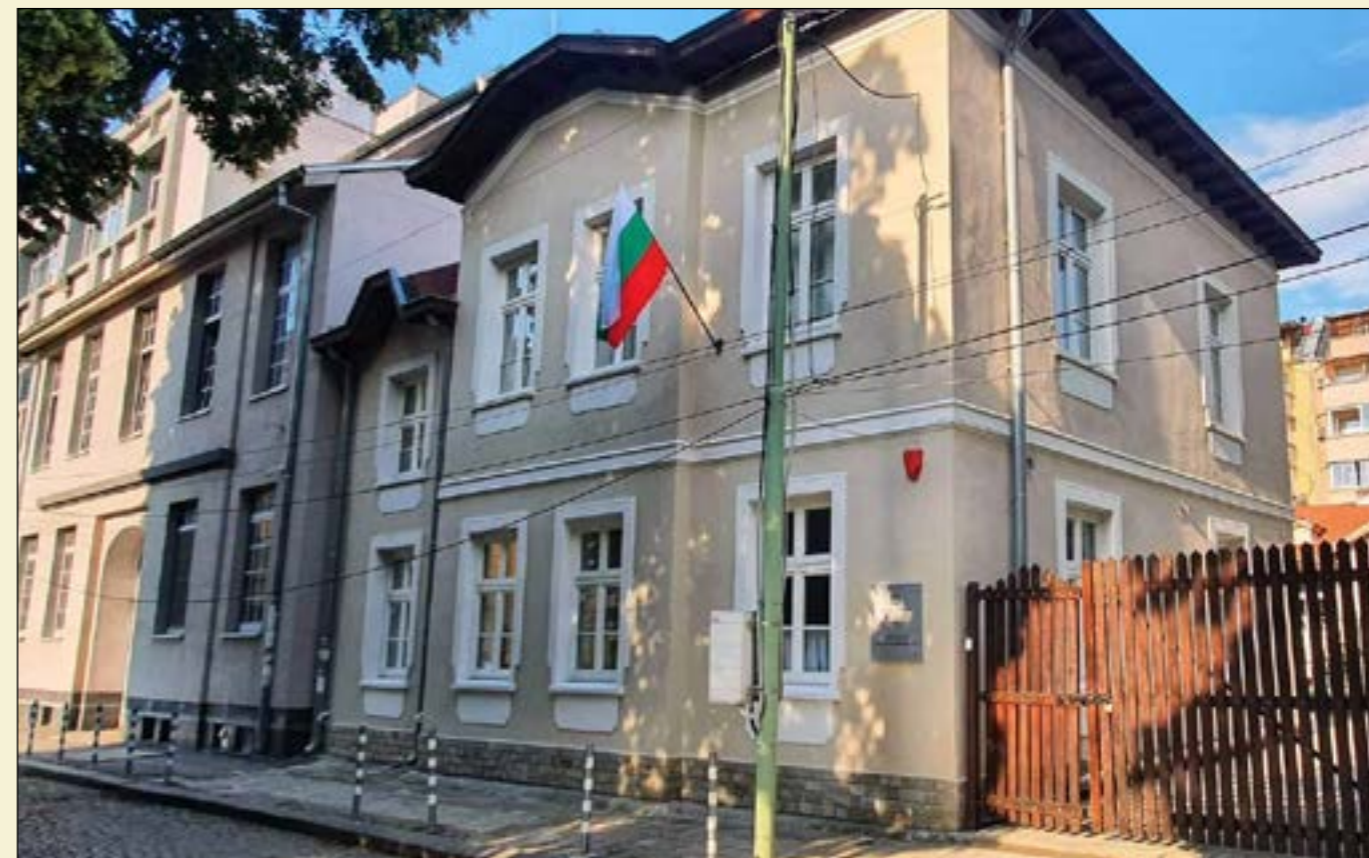
Къщата-музей „Христо Смирненски“ – вече приемаща посетители