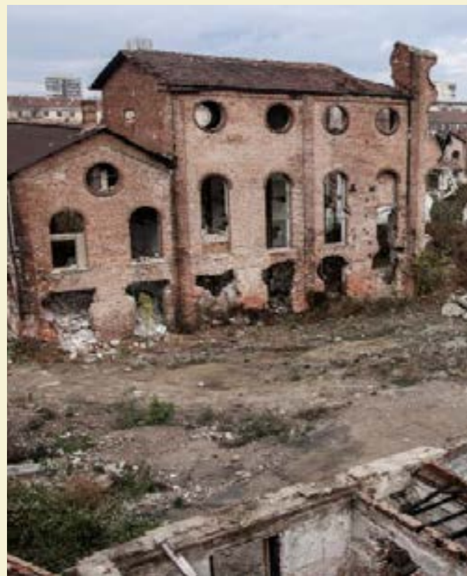
Захарната фабрика днес

В момента от нея е останал само скелета и няколко стени, чиито тухли по чудо все