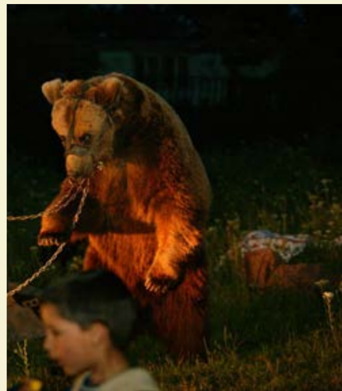
Години наред мечките са страдали от жестоката практика

Паркът е не само прекрасен дом за мечките, а и място, което е отворило вратите си за малки и големи. Той образова своите посетители за правата на животните по най-добрия възможен начин – като им поз-