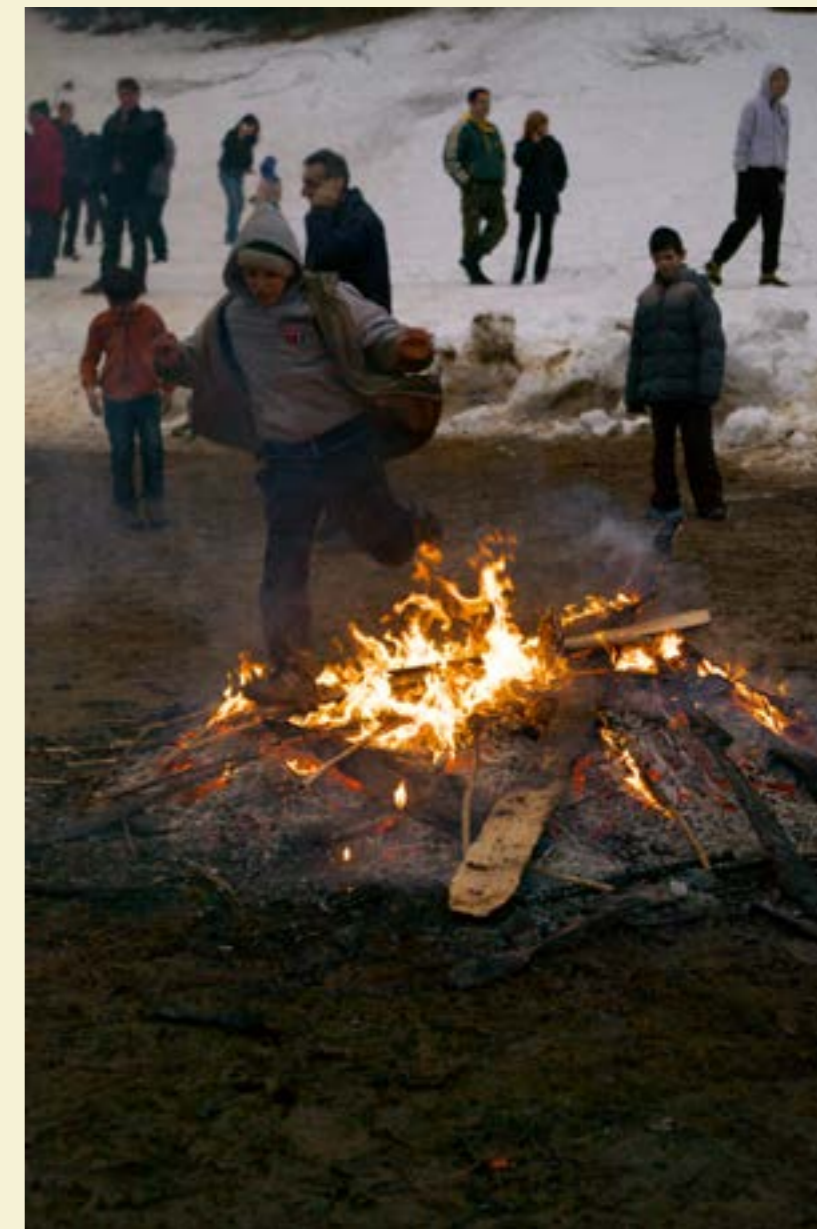
Огънят на Сирница се прескача за здраве

– в повечето наречия това зло са „бъйлите“ (бълхите), на които се заповядва да отидат в съседното село, у комшиите и т.н. В мое детство баща ми винаги наричаше нещо, звучащо по следния начин: „Ортоте ле, попе ле, бъйлите у комшиите, при нас парите!“